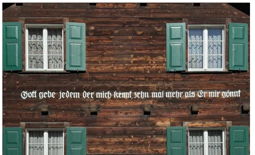
Ein schöner Wunsch!

Seniorenzmittag Donnerstag, 25. Juni, 12.00 Im Restaurant Bären Guttannen.